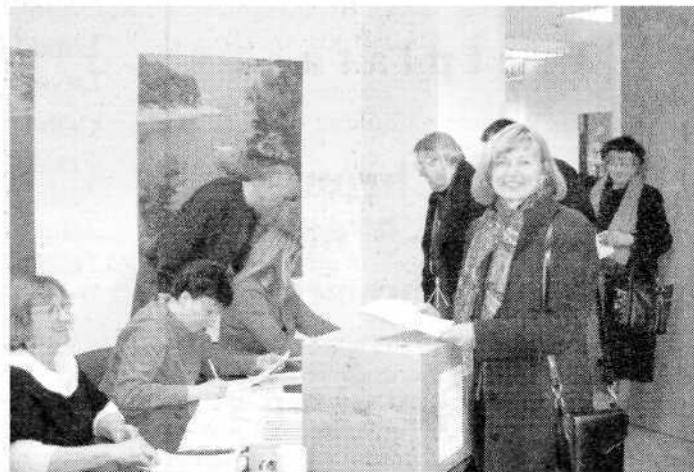
Predsjednički izbori u Chicagu, 16. siječnja 2005.

glasovalo 856 birača, od čega je 697 glasovalo za Jadranku Kosor a 147 za Stjepana Mesića. U Kanadi je izbrojano 1717 važećih listića, od čega 1.467 za kandidatkinju HDZ-a Jadranku Kosor, a 250 glasova dobio je Stjepan Mesić.