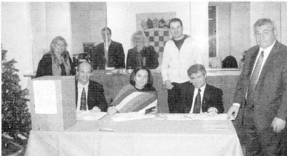
Izborna komisija u generalnom konzulatu RH u New Yorku, 2. siječnja izbrojila je 280 glasova