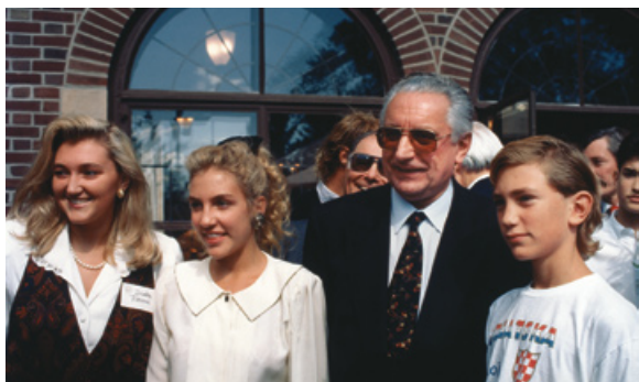
Borisova djeca s predsjednikom Tuđmanom prilikom povijesnog posjeta hrvatskog predsjednika SAD-u 1990.