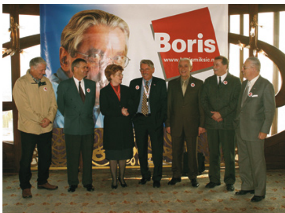
S kandidatima na neovisnoj listi Borisa Mikšića tijekom parlamentarne kampanje 2003.