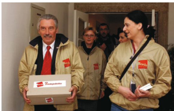
Predaja 10000 potpisa potrebnih za predsjedničku kandidaturu, Zagreb, 2004.