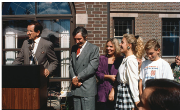
Guverner Perpich i Borisova obitelj u guvernerjevoj palači u St. Paulu 1990.