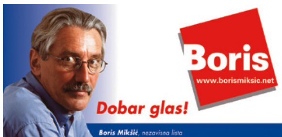
Borisov jumbo plakat proglašen najboljim na parlamentarnim izborima 2003. putem elektronskog glasovanja ( www.izbori.com ).