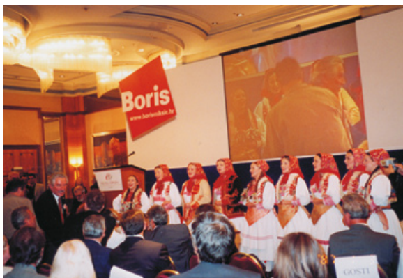
Skup podrške Borisu Mikšiću za predsjedničku kandidaturu u hotelu Opera u Zagrebu 2004.