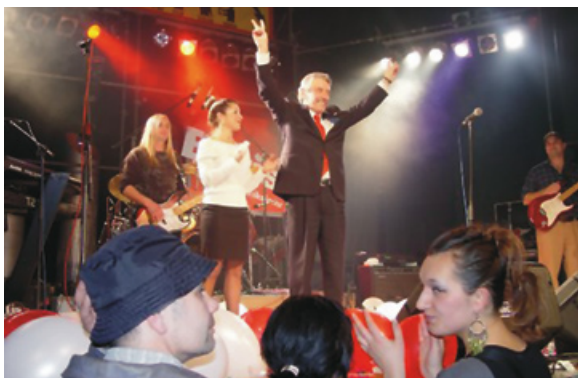
Središnji predizborni skup u Tvornici kulture, Zagreb, 2004.