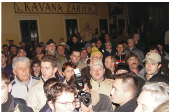
Prosvjed nezadovoljnih glasača nakon izborne prijave u predsjedničkoj kampanji, Zagreb, 2005.