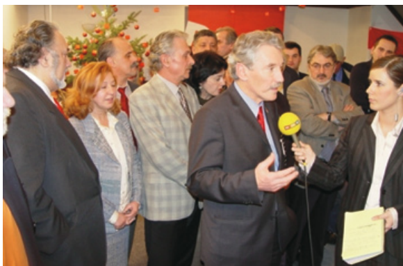
Tijekom izborne noći u stožeru u Ulici kneza Mislava, poslije “famozne” objave DIP-a da Mesić i Kosor ulaze u drugi krug, Zagreb, 2. siječnja 2005.