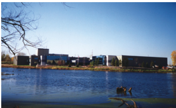
Sjedište Cortec Corporation, St. Paul.