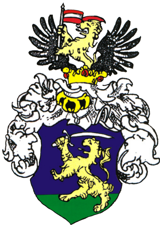
Grb obitelji Mikšić koja potječe iz okolice Lukavca u Turopolju (cca 1237. godine)