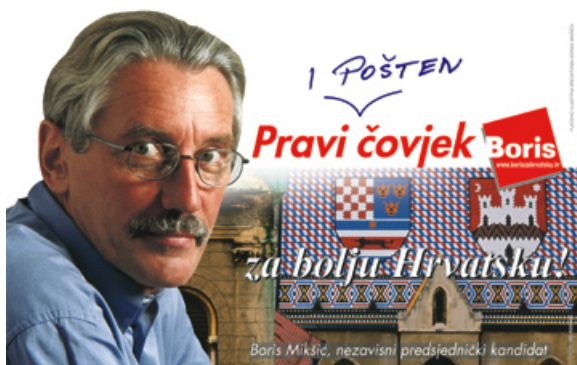
Jedan od tri jumbo plakata korištenih u predsjedničkoj kampanji 2004.