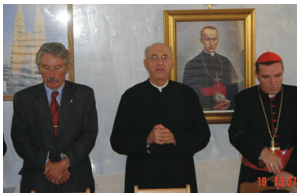
S kardinalom Bozanićem za vrijeme blagoslova crkve Hrvatskih mučenika, Hrnetić, 2004.