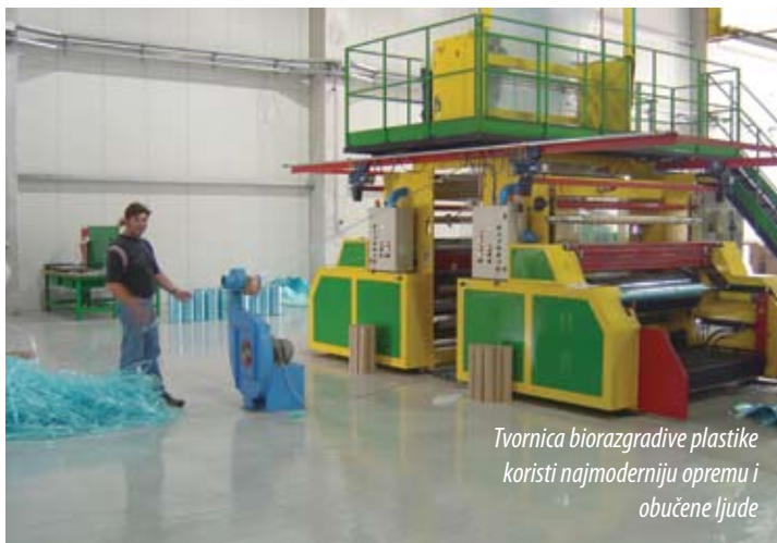
Tvornica biorazgradive plastike koristi najmoderniju opremu i obučene ljude

Bojim se recimo venture capitala, koji je u SAD-u u većini slučajje-