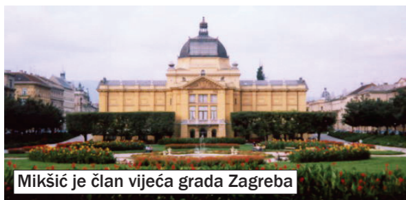
Mikšić je član vijeća grada Zagreba

Ako sami sebe ne cijenimo zašto bi nas i drugi cijenili i poštivali? Ipak završio bih s optimističnom porukom. Hrvatska je prelijepa zemlja i nadam se kako će novi naraštaji i mladi ljudi imati za nju više razumijevanja i osjećaja.