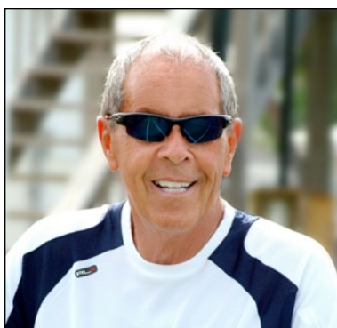
Nick Bollettieri - jedan od najvećih teniskih trenera svih vremena.