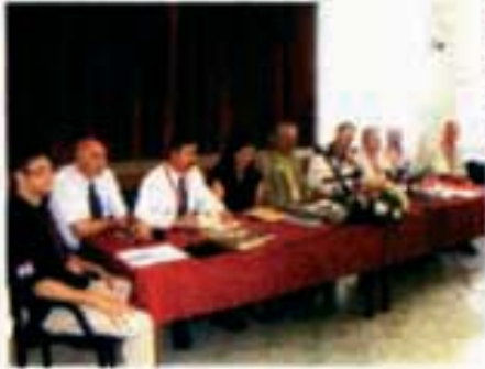
Na izbornom konvenciji Hrvatskoga svjetskog kongresa izabran su novi članovi upravnog odbora te razni odbori kongresa

Kongres je upozorio na jedan nedostatak: HSI okupile su 780 sudionika, 300 mladih, promatrača